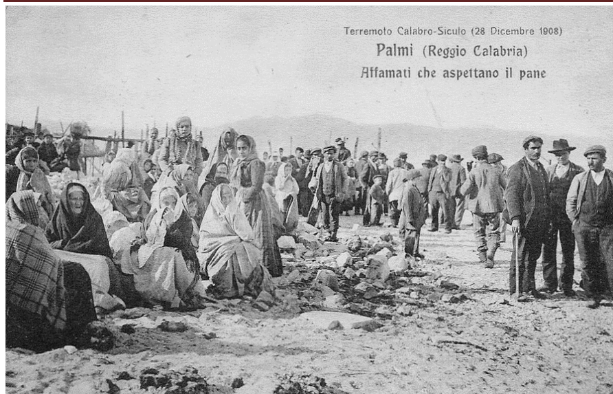
Terremoto Calabro-Siculo (28 Dicembre 1908) Palmi (Reggio Calabria) Affamati che aspettano il pane