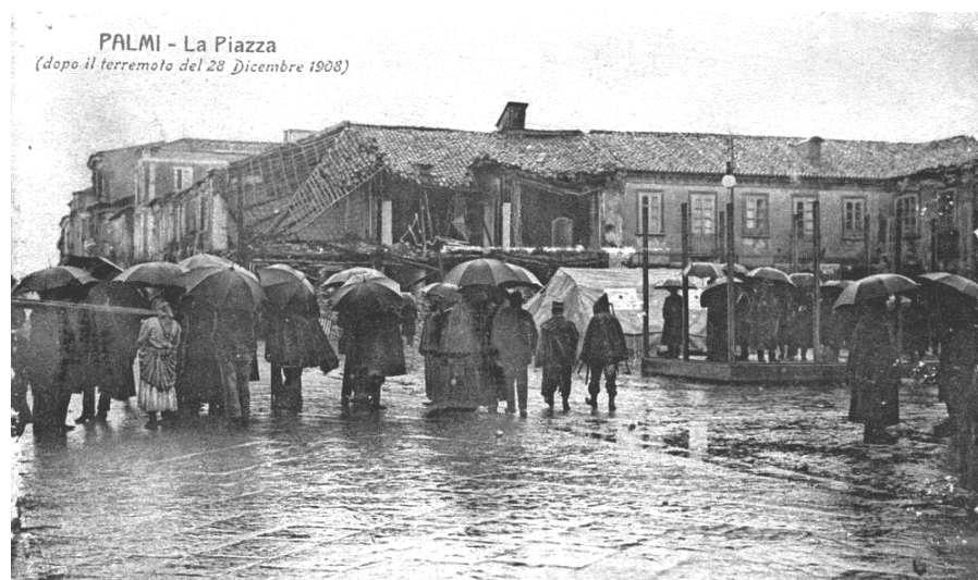
PALMI - La Piazza (dopo il terremoto del 28 Dicembre 1908)

Oltre a tale notizia la Gazzetta del giorno 11 ne riporta sul tema di ulteriori. Si era già dato il via alla costruzione delle baracche per i terremotati in un terreno apposito che ancora doveva essere espropriato, mentre la distribuzione dei viveri era effettuata normalmente