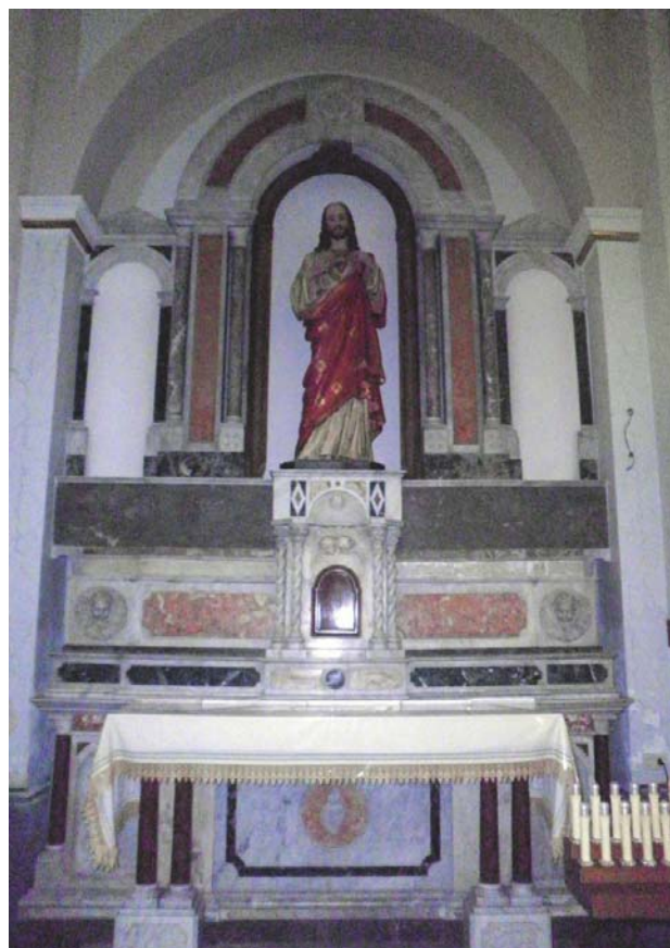
Il nuovo altare del S. Cuore di Gesù