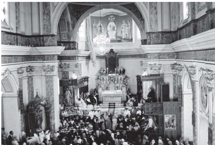
Interno della Chiesa Matrice di Polistena nell'anno 1962

sù, su cui faceva bella mostra un quadro in tela dello stesso titolo. Tale altare, durante l'arcipretura di Mons. Domenico Rodinò Toscano (1890-1926), molto probabilmente, venne sostituito con altro sormontato da stipo con ricco fastigio ligneo di stile moresco, in noce, opera del polistenese Giuseppe Silipo, dentro il quale fu sistemata la nuova statua in cartapesta modellata e dipinta del Sacro Cuore di Gesù, già presente, come vedremo avanti, nel 1897, ma che potrebbe essere stata acquistata da poco. Anche quest'ultimo altare ligneo, nel 1935, fu sostituito da altro marmoreo (quello tuttora esistente nella navata sinistra, situato subito dopo quello con la cinquecentesca Pala Marmorea con la Deposizione di Nostro Signore Gesù Cristo), opera dei marmorari messinesi