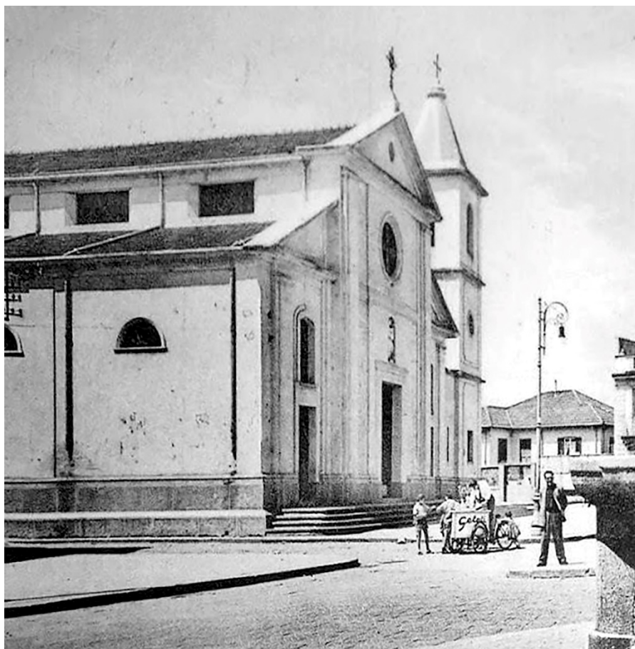
La chiesa parrocchiale di Iatrinoli (oggi Taurianova) sotto il titolo dei Santi Apostoli Pietro e Paolo

sotto la sua dichiarazione, suffragata dalla firma del sacerdote 17 .