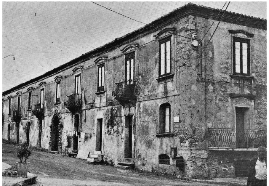
Serrata, Palazzo Cuccomarino