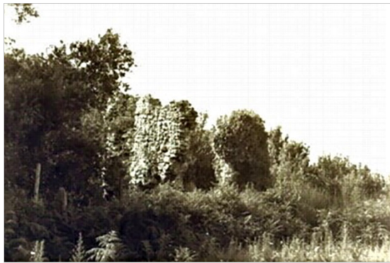
Resti di antico convento presso Borrello