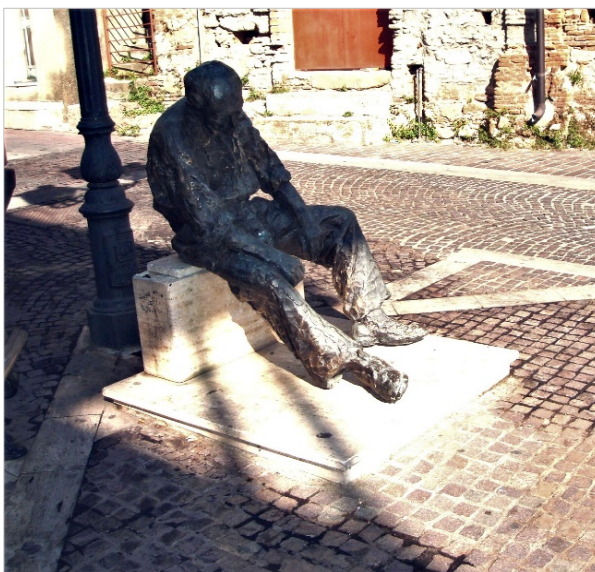
Serrata, Monumento all'Emigrante

Da quanto scoverato ci si rende conto che al tempo a Serrata la comunità, eccetto pochi fortunati, viveva molto miseramente sforzandosi a produrre qualcosa di buono soltanto con l'aiuto delle braccia. Nonostante una tale situazione, non è che essa fosse esente da pesi fiscali che venivano anch'essi a ridurre i già scarsi introiti. Da quanto segnala il catasto era la Corte Ducale di Monteleone a incassare la maggior parte delle tasse. La si