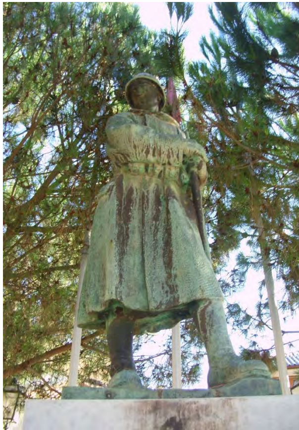
Il fante del Monumento ai Caduti in guerra di Serrata