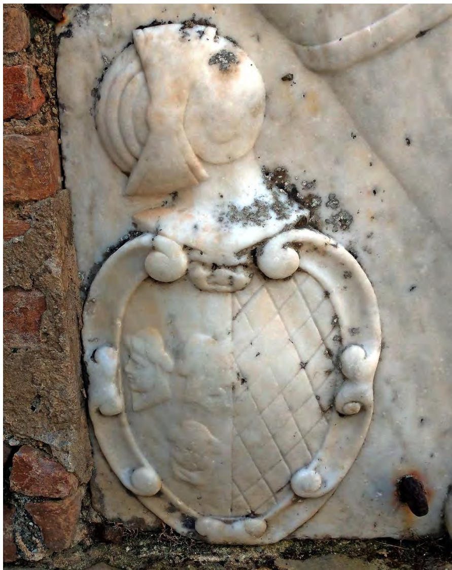
Particolare dello stemma gentilizio

lui stesso, si era circondato di famosissimi uomini d'arme. Primo fra questi era Filippo Moretto che fu amico del suo imperatore. Fra le gesta più gloriose del Moretto, vanno annoverate le espugnazioni di Tunisi, di Ostia e della Goletta 16 .