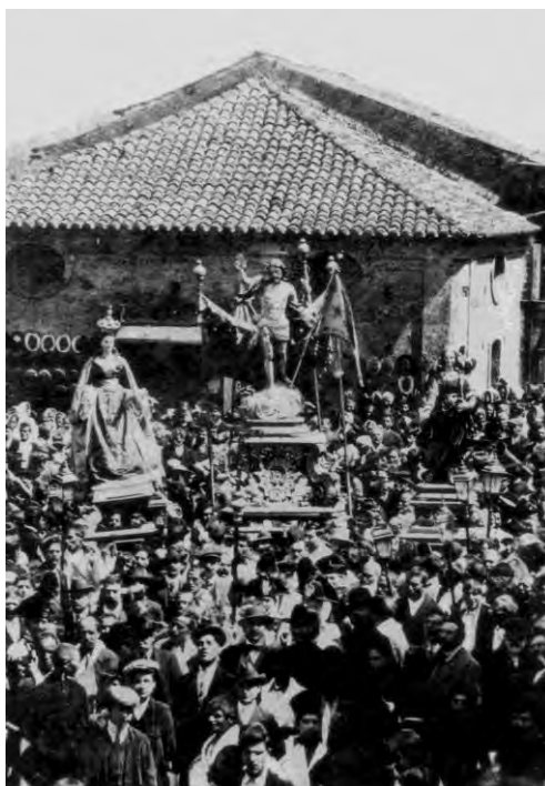
Affruntata a Rizziconi nei primi anni '20

Ma veniamo alla cronaca. È la fresca e bonaria mattina di Pasqua: all'uscita della messa mattutina le donne, evitando fra comari, guadagnano frettolose la via di casa per completare il pranzo pasquale e non mancare all' Incontro . Di buon'ora, infatti, sono già in molti a cercare una sistemazione favorevole per seguire, nel migliore dei modi, l'atteso avvenimento: da qui a poco, ogni angolo di strada, balcone, finestra, terrazza, ogni