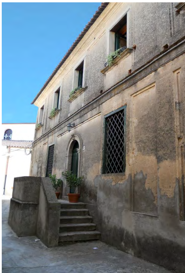
Palazzo Nicoletta a Maropati

Ancora si attesta la presenza del cognome Ciurleo come già radicato a Maropati nei primi dell'800. A conferma