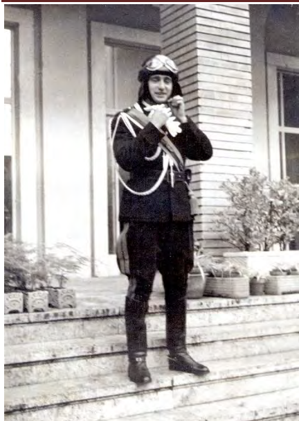
Giovane ufficiale dei Carabinieri in servizio di scorta al papa Pio XII

una tavola provvista di ruote... Si era, insomma, coscienti che il rispetto e l'amore erano più importanti della fama e della gloria. Ma, la genialità di Domenico Cavallari, a mio avviso, sta nell'aver saputo intercalare all'interno delle sue sillogi momenti, ambienti e tematiche diversi proprio per scansarsi dalla eventualità di inciampare in un laconico schematismo letterario.