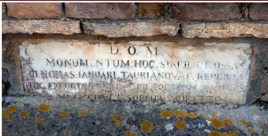
Lapide a ricordo del ritrovamento del 3 gennaio 1878

4 ERCOLE RICOTTI, Storia delle compagnie... , op. cit., p. 83.