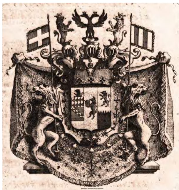
Stemma araldico della famiglia Milano

7 J.J. ROUSSEAU, voce Préluder , in Dictionnaire de musique , Parigi, Duchesne 1768: "C'est pa ce grand Art de Préluder que brillent en France les excellens Organistes, tells que son maintenant les sieurs Calvière & Daquin, surpasse, toutefois l'un et l'autre par M. le Prince d'Ardore, Ambassadeur de Naples lequel, pour la vivacité de l'invention & la force de l'exécution efface les plus illustres Artistes & fait à Paris l'admiration des connoisseurs".