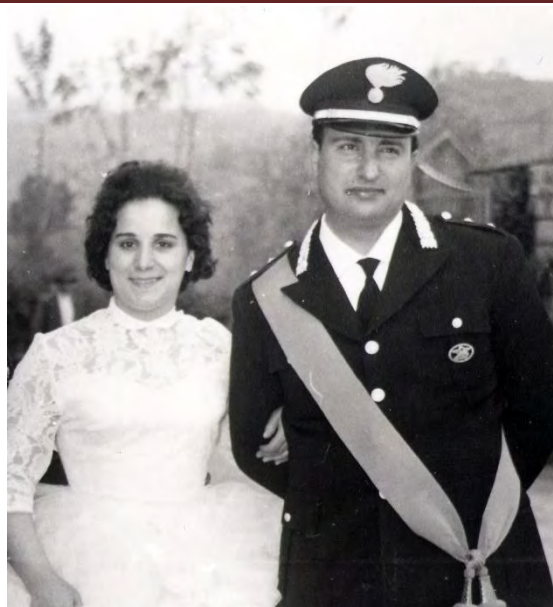
Con la moglie, il giorno del matrimonio

Il testamento spirituale di Domenico Cavallari è custodito nelle sue opere che non sono altro che i diari di un'esistenza: pagine di memorie scritte con il cuore, a volte condite con sapiente ironia, altre