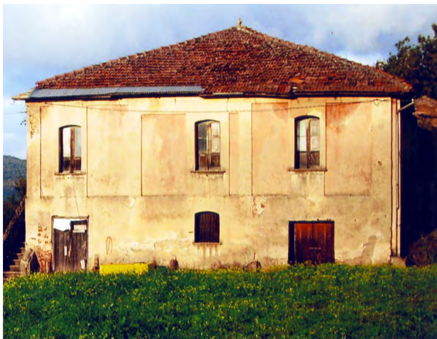
Villa Cavallari a Pescàno