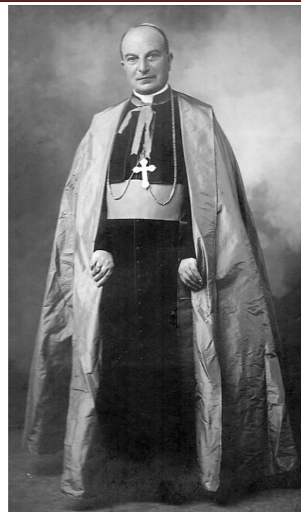
Mons. Nicola Colangelo, vescovo di Oppido dal 1932 al 1935, con il mantello ferraiolo

Canone vescovile 75 usato, foderato di coperta di vitellino rosso con le armi vescovili; un manto vescovile di saja di Milano color pavonazzo con mostre d'armesino cremis e finalmente era dentro detto baullo un camicio di merletto; una croce d'argento dorato vescovile, col suo fiocco verde; altra croce di argento ed oro con pietre grandi di smeraldi al numero di sei e dieci diamanti piccioli anche per uso vescovile con suo fiocco verde ed oro e un anello vescovile con pietra di zaffiro» 76 .