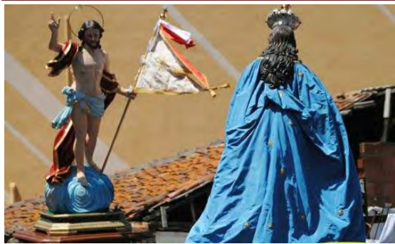
L'incontro tra Cristo e Maria

sottolineato da uno scrosciante e incoraggiante applauso che fa "galoppare" il Santo verso l'assolvimento del suo compito di "Ambasciatore della Resurrezione".