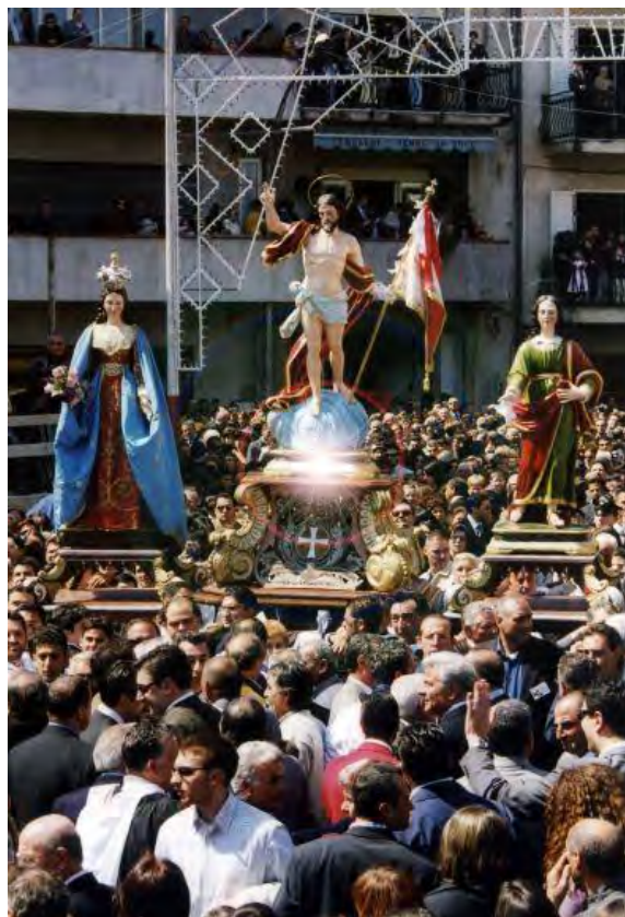
Affrontata a Rizziconi: il trittico (Anni '90)

serci stato e di aver contribuito, nel suo piccolo, alla buona riuscita dell'avvenimento e alla continuazione di una tradizione così profondamente radicata nelle popolazioni del territorio. Ogni volta, gli occhi di molti - specie quelli di anziani ed emigrati - sono rossi e gonfi: tanti hanno ricordato le Affrontate della giovinezza, i cari scomparsi, gli amici perduti, i tempi passati. Anche se per poco, avversità, disgrazie e miserie umane sono state messe da parte. E tutti, inconsapevolmente, si sono sentiti più uniti nella speranza di una vita migliore, di un futuro sereno di salute e di pace.