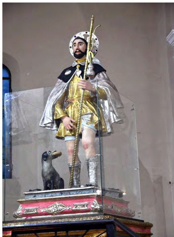
La statua di san Rocco di Acquaro

si evidenzia a Catanzaro sin dal 1529, il culto verso San Rocco è stato proclamato da gran tempo. Altra nella stessa provincia si evidenzia per il 1682 quella di Girifalco. Una tale venerazione risulta in auge soprattutto a Gioiosa, Scilla e Palmi. È meritevole di particolare attenzione la festa che annualmente si svolge a Gioiosa con processione della durata di ben 6 ore, il cui primo ricordo rimonta al finire del secolo XVI. Così anche a Scilla, dove l'origine del culto è fatta risalire ai rapporti di carattere marinaro intessuti lungo tempo con Venezia, la città che ha curato di tumulare i resti del Santo in apposita chiesa nel 1485. Particolarmente seguita è la festa in onore di San Rocco a Palmi, dove una chiesa in suo onore è presente sin dal 1586. Allora a notarla è stato il vescovo del Tufo, che vi si era recato in sacra visita. La relativa processione, inizialmente della durata di 4 ore e mezza, oggi ridotta a 2 e mezza, è di grande richiamo per le popolazioni del circondario. Una nota caratteristica è portata dai cosiddetti spinnati , penitenti recanti una cappa di spine, che seguono la processione in mezzo alla folla. Nello stesso anno 1586 il vescovo notava la presenza di una chiesetta di San Rocco anche a San Martino 5 .