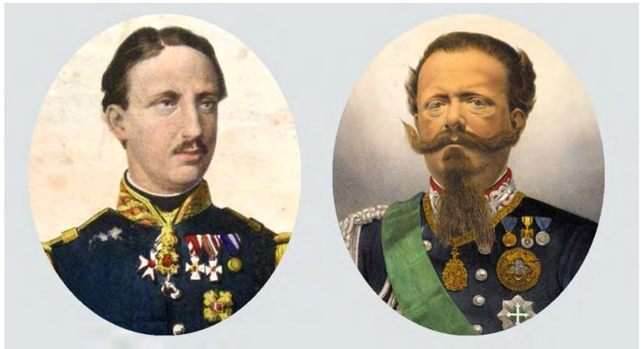
Francesco II di Borbone e Vittorio Emanuele II di Savoia

La mattina del 21 ottobre, alle prime luci dell'alba, si videro affissi sui muri, in più punti dell'abitato, diversi manifesti con la scritta: «Viva Francesco Secondo» ed altre espressioni «... ch'eran state poste in quella passata notte da Giuseppe Lombardo, Domenico Carbone ed Antonino Cannatà fu Girolamo per essere costoro venuti nella scienza che in Cinquefrondi era seguita in quella decorsa sera » 2 . A Cinquefrondi, infatti, i seguaci filoborbonici facenti capo al principe Luigi Ajossa, ex ministro degli Interni del governo borbonico, e alla sua famiglia, diedero vita a una decisa reazione e al grido di «Viva Francesco III! Morte a Garibaldi, Vittorio Emanuele e a tutti i liberali!», venne issata