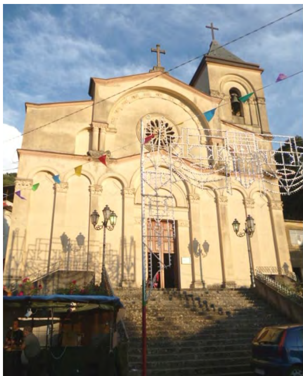
La chiesa di Acquaro