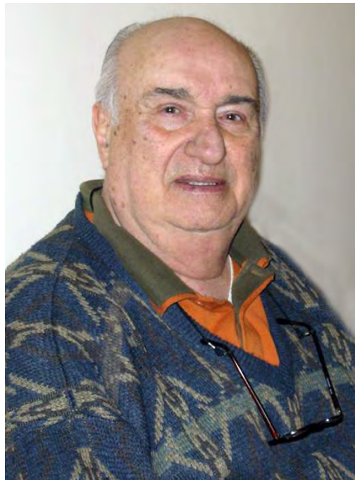
(Maropati 24.10.1931 – Caserta 07.02.2019)