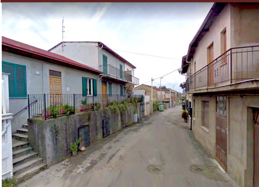
La zona teatro degli scontri del 1860 nei pressi del vecchio Calvario