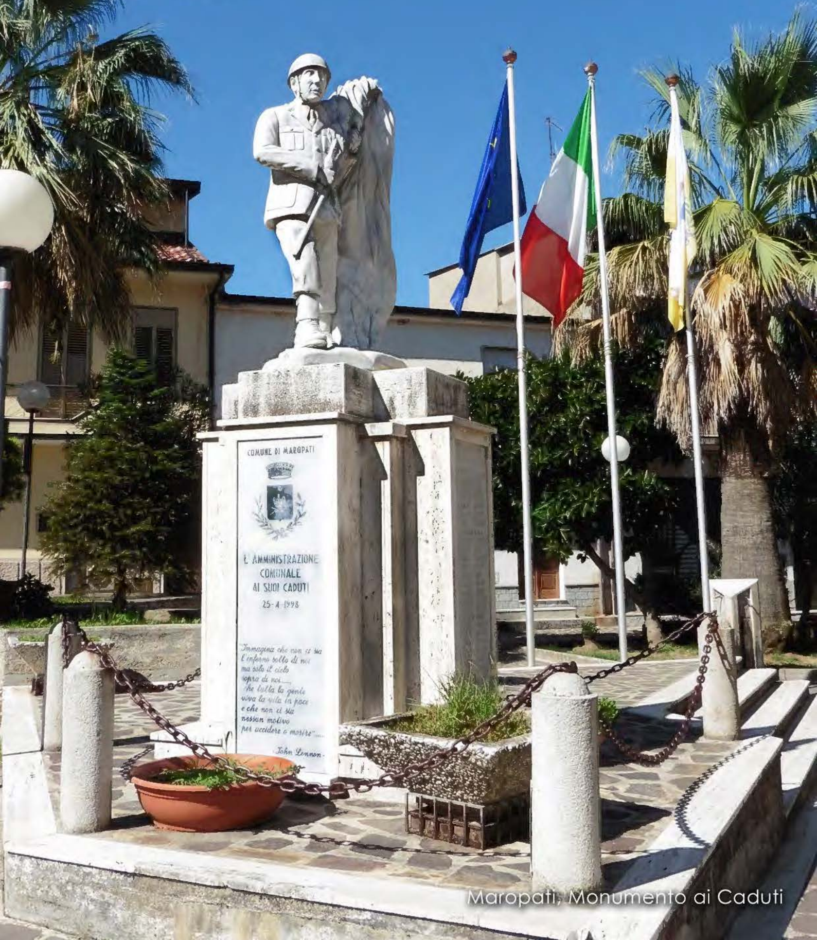
Maropati, Monumento ai Caduti