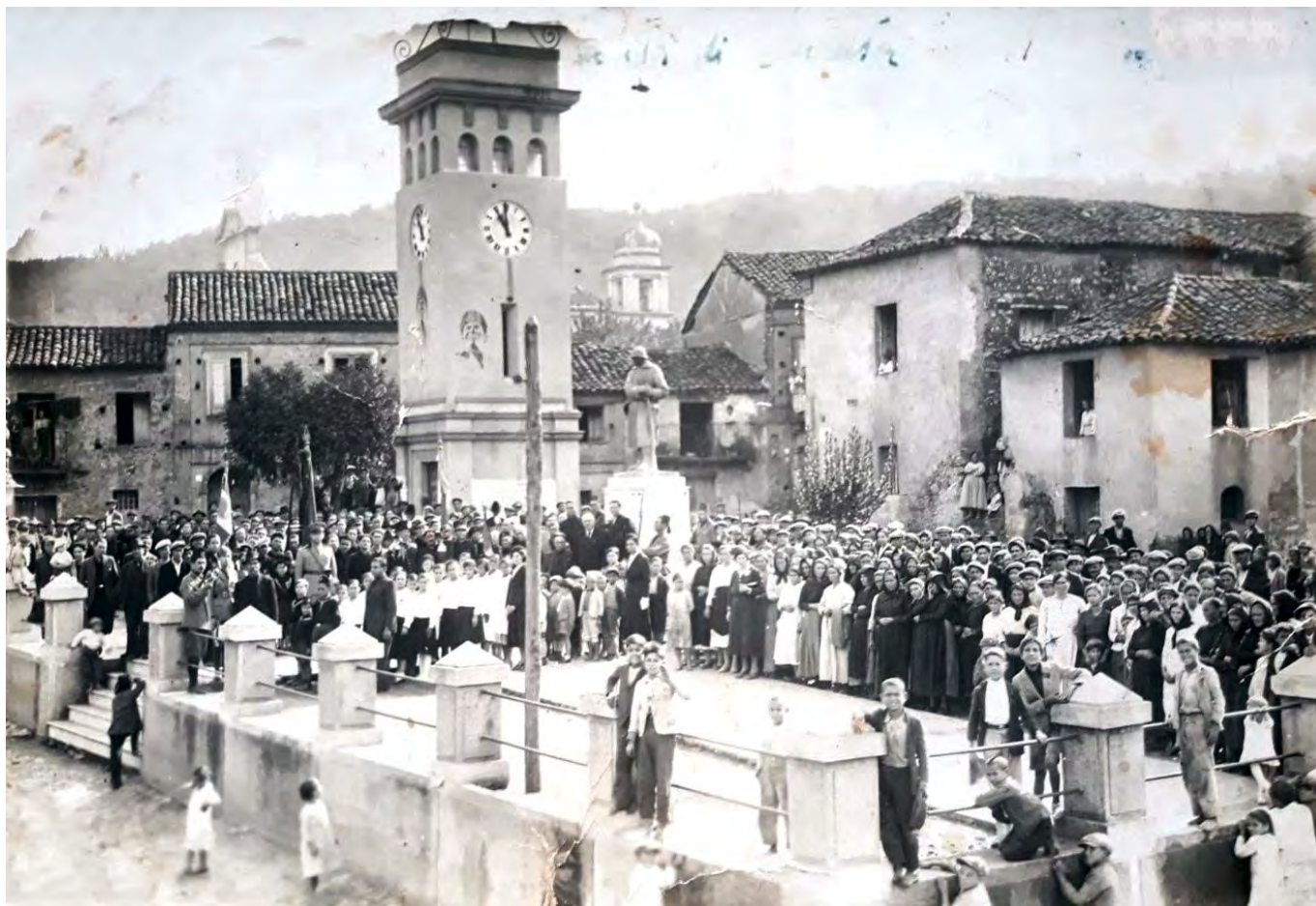
Adunata fascista a Serrata

programma nazionalistico. Autoproclamatosi “Führer e cancelliere del Reich”, accentrò su di sé tutti i poteri col disegno di fare della Germania una potenza economica e militare egemonica all’interno dell’Europa. Nel 1935 promosse le leggi razziali che colpirono prevalentemente gli ebrei confiscandone i beni. Superate le iniziali incomprensioni, nel 1936 strinse rapporti con il dittatore Benito Mussolini mediante la stipula di un trattato d’alleanza noto con il nome di “asse Roma-Berlino” (in opposizione agli stati alleati e ratificato nel 1939 con il “Patto d’Acciaio”), trascinando tutte le nazioni nel vortice della Seconda Guerra Mondiale. L’Italia sia pure impreparata e senza armamenti adeguati entrò in guerra il 10 giugno 1940 con l’attacco alla Francia. Seguirono altri e più impegnativi combattimenti su più fronti, culminati con la guerra di liberazione nazionale , conclusasi il 25 aprile 1945 con la cattura e fucilazione di Mussolini e dei gerarchi fascisti in fuga verso la Svizzera.