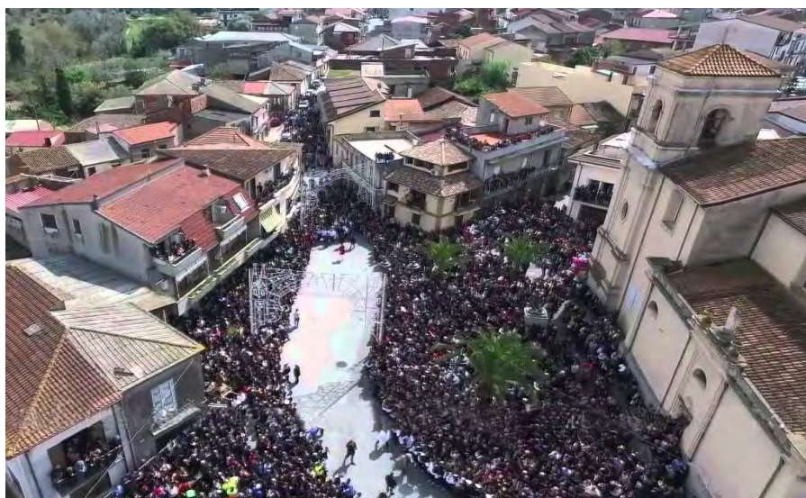
Il centro di Rizziconi colmo di gente nelle fasi dell' Affrontata

1 La Confraternita del SS. Rosario in Rizziconi, alla cui presenza è legato il rito dell' Affrontata , è stata fondata l'11 marzo 1781 con reale assenso del Re Ferdinando IV (Ricerca di don Antonino De Masi presso Archivio di Stato di Reggio Calabria).