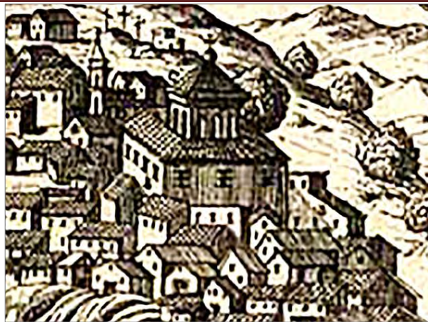
Il palazzo marchionale nella stampa secentesca del Pacichelli