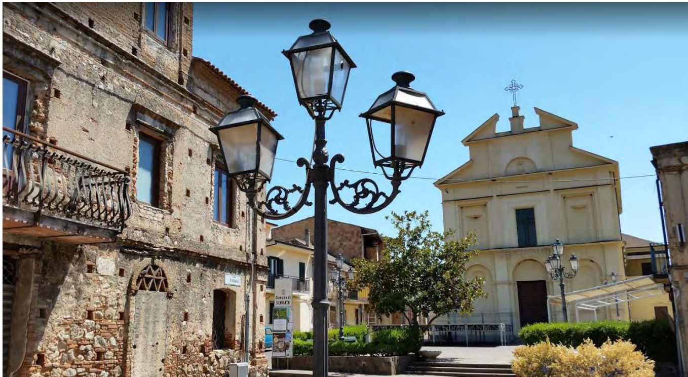
Scorcio di Serrata con la Chiesa Parrocchiale