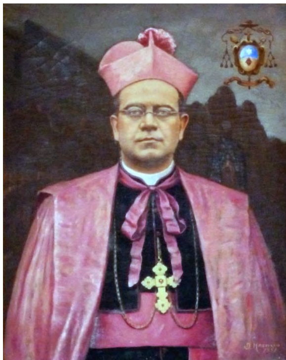
Mons. Nicola Canino vescovo di Oppido dal 1937 al 1951

Il volo dei palloni non era comunque una prerogativa della festa di San Rocco, in quanto si praticava anche in occasione della festività maggiore. In un atto comunale del 7 dicembre 1911 si attestava un pagamento di £ 222,45