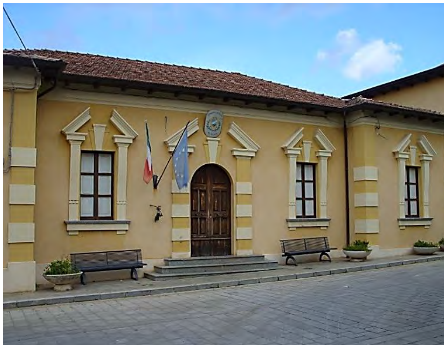
Il palazzo municipale di Serrata

Solerte, però, fu lo Stato a chiamare alla leva tutti i giovani validi alle armi e arruolati nel regio esercito da contrapporre all'apparato militare austro-ungarico che minacciava i confini nord orientali d'Italia. Alle sanguinose operazioni militari della Grande Guerra, quindi, parteciparono tutti i giovani coscritti abili e arruolati che, dopo un sommario addestramento, furono avviati al