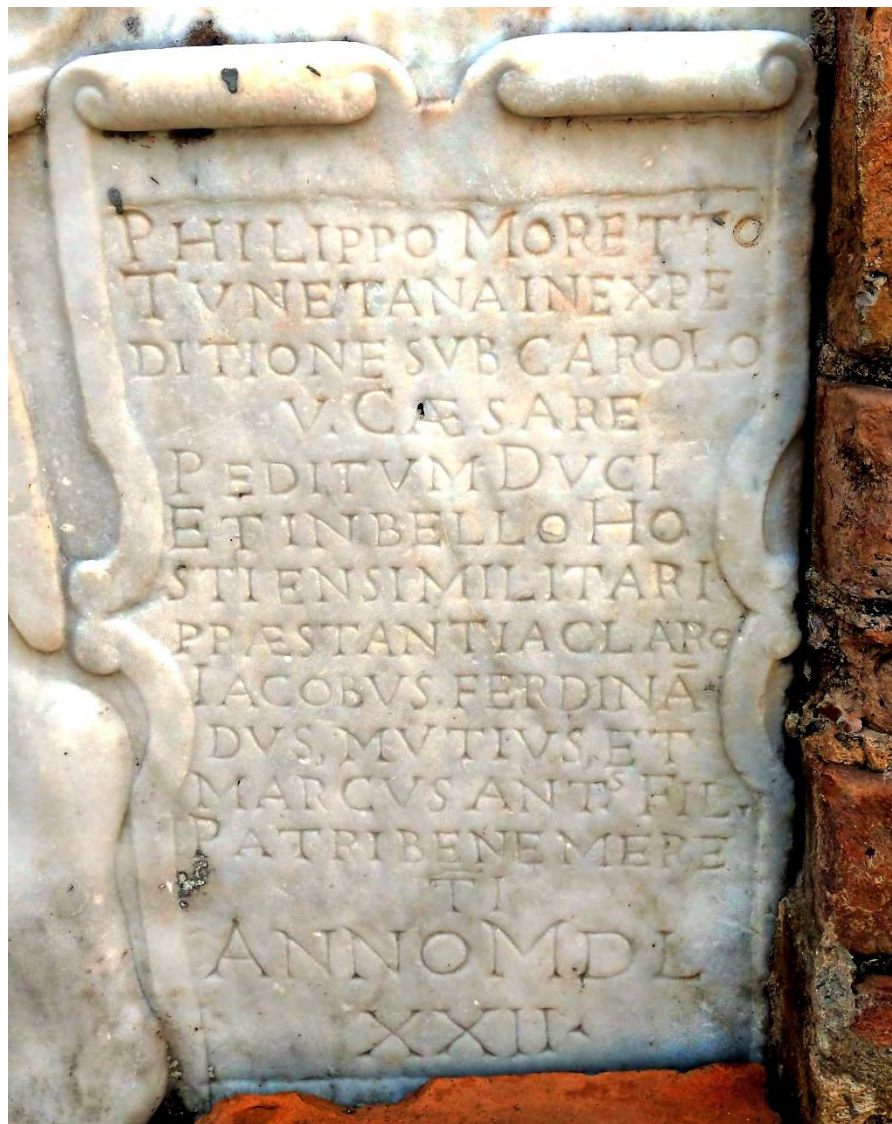
Particolare dell'iscrizione del 1572

Riporta Nicola Leoni che «L'ammasso delle cadute terre interruppe il corso del Sali, onde si formarono due la-