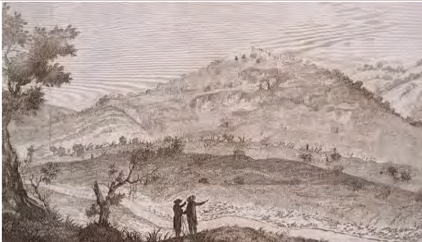
Avanzi di Molochiello e squarcio della sua Rupe, nell'incisione dello Zaballi

Nel XVI secolo lo stupro è così frequente e diffuso che i governanti prendono provvedimenti per punirlo severamente. Una legge «sopra gli stupri», infatti, viene emanata il 9 febbraio 1542 13 .