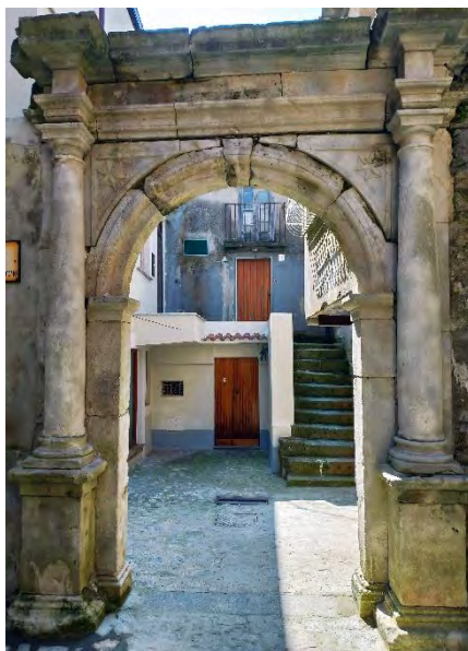
Arco della Cappella Palatina