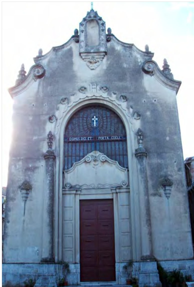
La chiesa dell'Abazia

In Calabria, dove una prima confraternita